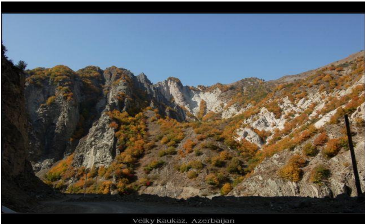
Velky Kaukaz, Azerbajjan