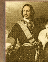
Peter I. Veľký