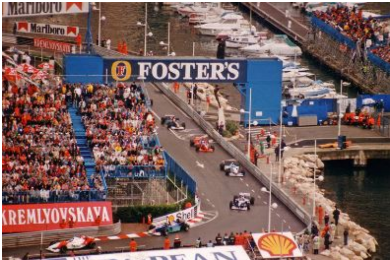
Veľká cena Monaka