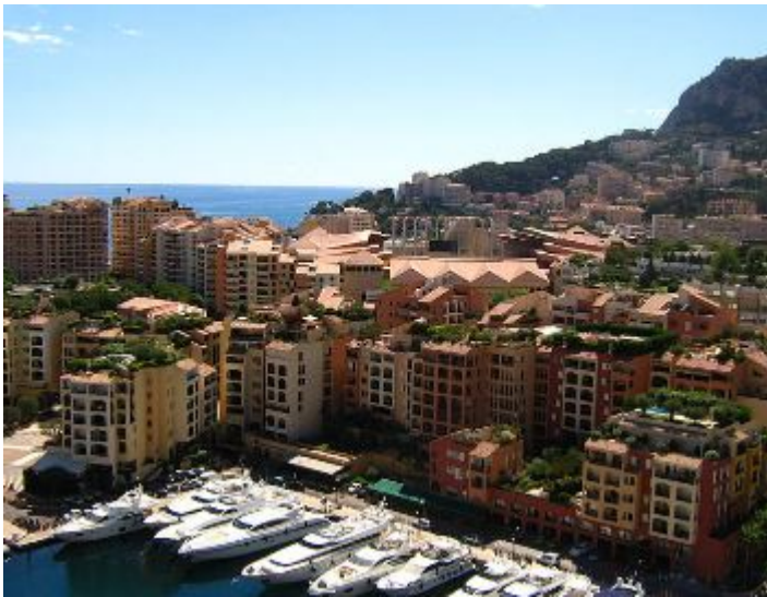
Fontvieille - jedna z mestských častí Monaka