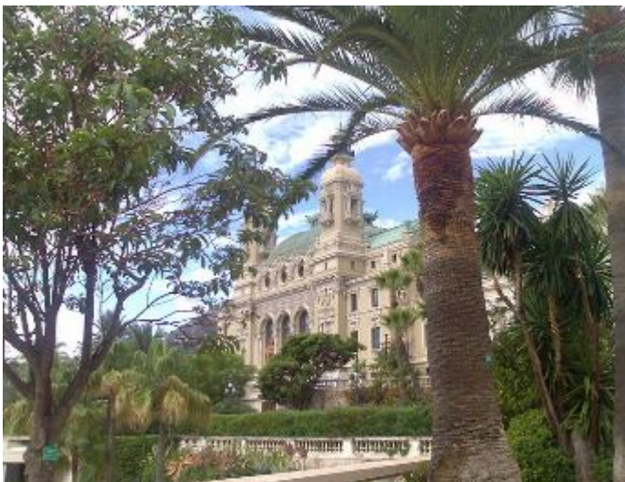
Monte Carlo - kasíno